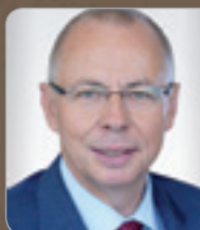
Prof. Dr. Bendlinger Steuerberater ICON Wirtschaftstreuhand GmbH