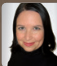
Mag. Hack Fachexpertin Großbetriebsprüfung